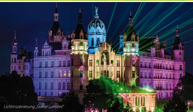
Lichtinszenierung „Son et Lumière“