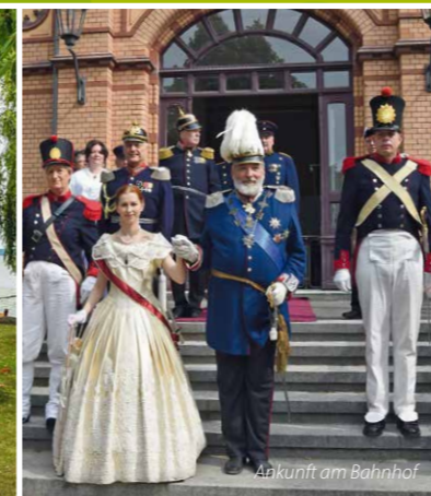
Ankunft am Bahnhof