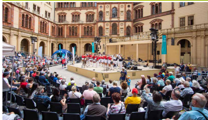
Bühnenprogramm im Innenhof

Kantate von Carl Orff 8. Juli 2023, Freilichtbühne Schwerin