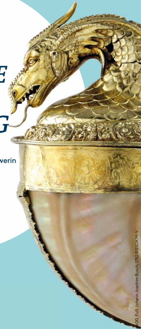
Turbanschneckenpokal, Nürnberg, um 1600, Foto: Johann Joachim Burch, 1752 ©SSGK M-V

Eine Ausstellung des Staatlichen Museums Schwerin im Schloss Schwerin 8.7.2022 – 7.1.2024