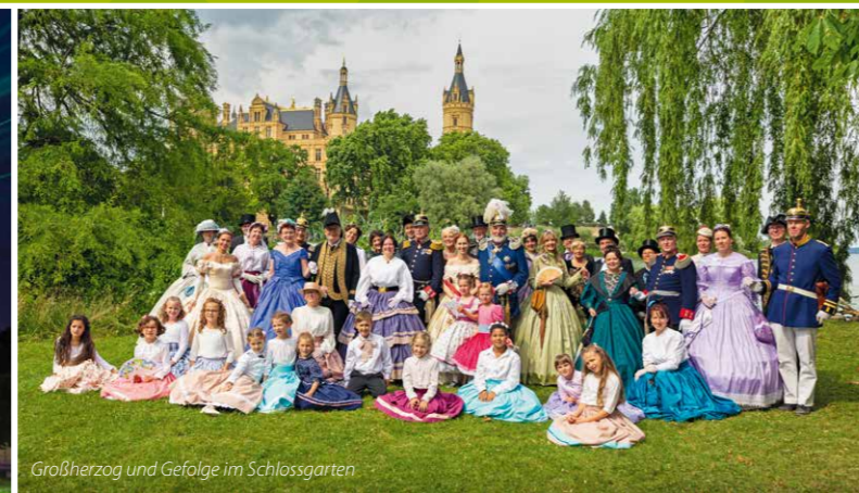
Großherzog und Gefolge im Schlossgarten